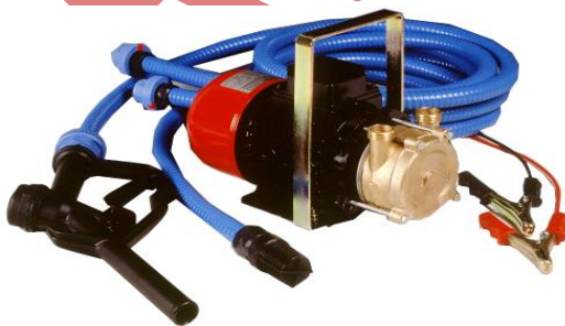
ECC (ครบชุด) พร้อมสาย 3 ม.

คุณสมบัติ: ดูดลึกได้ถึง 6 ม. / มอเตอร์กระแสตรง 12 / 24 Volts พร้อมแผงวงจร IP23 ใช้กับของเหลวที่ไม่มีวัตถุหนัก เลื่อปั๊มทองเหลือง ใบพัดทองเหลือง เพลาสแตนเลส AISI 316