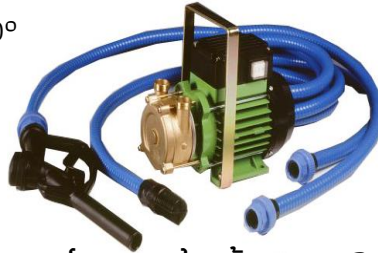
EEM (ครบชุด) พร้อมสาย 3 ม.