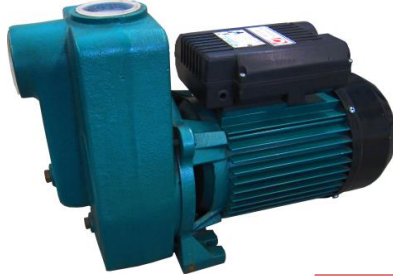
ECO - 100PS