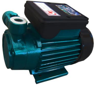
ECO - 1002 - 1

โครงสร้าง : เสื้อเหล็กหล่อ แมคคานืเคิลซืล สามีรณใช้ท่กับเจืทเดี๋ยวได้