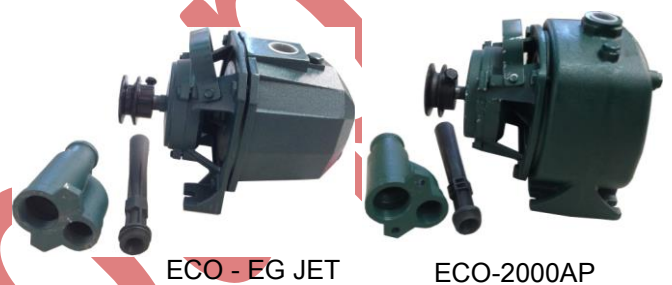
ECO - EG JET

หัวปั๊ม JET แบบดูดน้ำลึก และส่งสูง สำหรับต่อกับมอเตอร์ขับเคลื่อนกำลัง หรือต่อกับเครื่องยนต์ที่ใช้น้ำมันได้