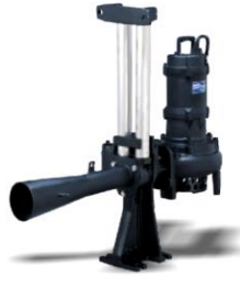
JP SERIES + GRS SERIES