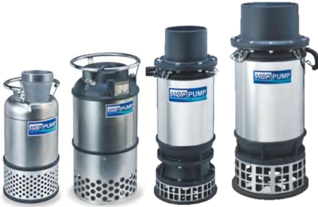
L-405A/ L-41A L-62•63A L-200A/ 250A L-300A