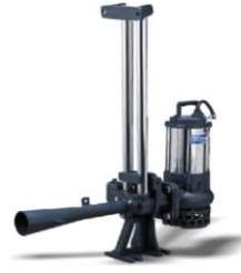
JF SERIES + GRS SERIES