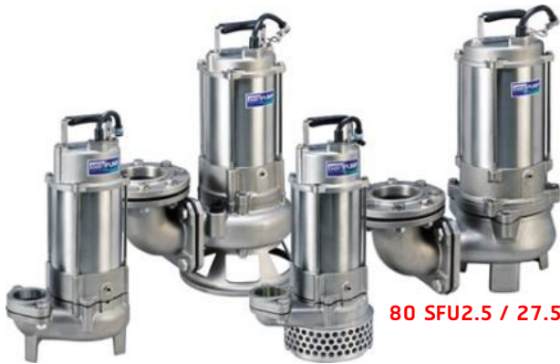
50 SFU2.4A / 2.8