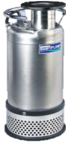
IC-32B/33B , IC-43B/45B