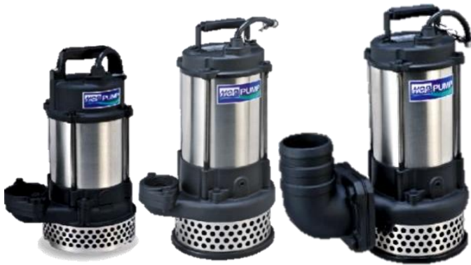
A05A/B A-23 / AN-22, AN-23 A-43 / AN-43, AN-45

คุณสมบัติ : สายไฟหุ้มด้วย Epoxy resin ป้องกันน้ำเข้า, แมคคาทรอนิกส์ 2 ชั้น, มีระบบ Auto-cut, มอเตอร์แห้ง (ยกเว้นรุ่น A-05, มอเตอร์หล่อเย็นแบบน้ำมัน และซิลิโคนเดี่ยว (CA/CE)