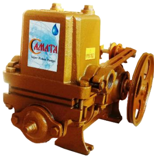
ขนาด 1 นิ้ว