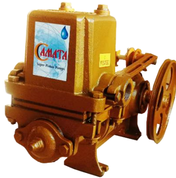
ขนาด 1 ½ นิ้ว - 2 นิ้ว